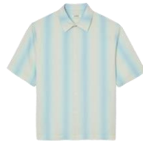
SHPCM01022 SS24 CHEMISE MC RAYEE 495€ / 131€ €219 / £147