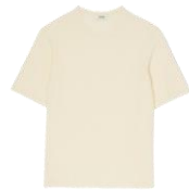
SHPTR00553 SS24BOUCLE TSHIRT 185€ / 124€ €209 / £141