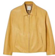
SHPBL00949 SS24 BLOUSON CUIR MINIMAL USED 1195€ / 801€ €1329 / £891