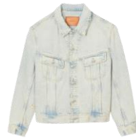
SHPBL00918 E24FRAYED DENIM JACKET 295€ / 198€ €329 / £221