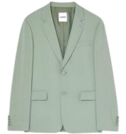
SHPVE00926 E24FORMAL 525€ / 352€ €529 / £355