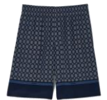
SHPBE00074 E24FENCE SHORT 195€ / 131€ €249 / £147