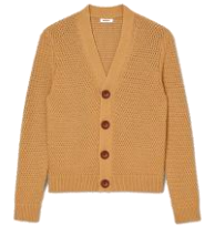
SHPTR00566 SS24 CARDIGAN CARLO 265€ / 178€ €289 / £194