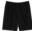
SHPBE00078 SS24 SHORT LARGE 225€ / 151€ €249 / £167