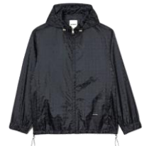
SHPBL00922 E24SURF SQUARECROSS NYLON JACQUARD LEGER 345€ / 232€ €379 / £254