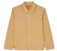
SHPBL00756 BLOUSON WORKER AVEC POCHES POITRINE 275€ / 185€ €309 / £208