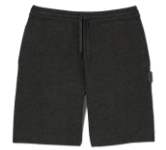
SHPBE00071 HOME SHORT PATCH EN CUIR 185€ / 124€ €209 / £141