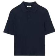
SHPTS01356 POLO PHOEBE 175€ / 118€ €189 / £127