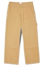
SHPJE00490 REGULAR CARPENTER SURTEINT 195€ / 131€ €219 / £147