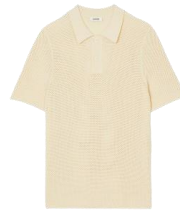
SHPTR00531 SS24 PABLO SPORT 225€ / 151€ €249 / £167