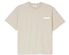
SHPTS01383 E24RUBBER PATCH TEE 95€ / 64€ €99 / £67