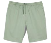
SHPBE00057 E23NEW GAMMA 465€ / 111€ €179 / £120