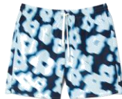
SHPMB00037 SS24BLURRY FLOWER SWIM 145€ / 98€ €159 / £107