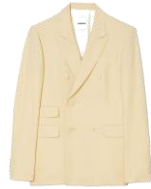
SHPVE00938 E24CROISE AMF 585€ / 392€ €589 / £395