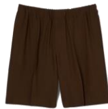
SHPBE00078 SS24 SHORT LARGE 225€ / 151€ €249 / £167