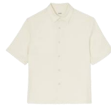
SHPCM01032 SS24 CHEMISE MC FLUIDE SNAPS 195€ / 131€ €219 / £147