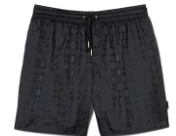
SHPMB00042 E24SQUARECROSS JACQUARD MDC 145€ / 98€ €159 / £107